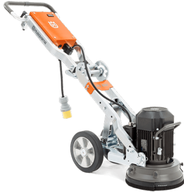
(slika je simbolična)