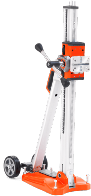
(slika je simbolična)